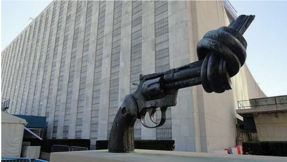
Escultura la Pistola Anudada 1

El mundo pasa por su peor momento después de la Segunda Guerra Mundial. Actualmente hay 56 conflictos activos que involucran a 92 países de acuerdo al Institute for Economics & Peace . Es un mal presagio para la humanidad, la incapacidad de tratar las contradicciones a través de la palabra. Y no es que se tenga desconocimiento de mecanismos para tratar conflictos por vías alternativas a la violencia, por el contrario todo está sobre la mesa. Lo que sucede es que entre otras cosas, los intereses geopolíticos de controlar territorios para obtener a precios irrisorios sus recursos son cada vez más voraces.