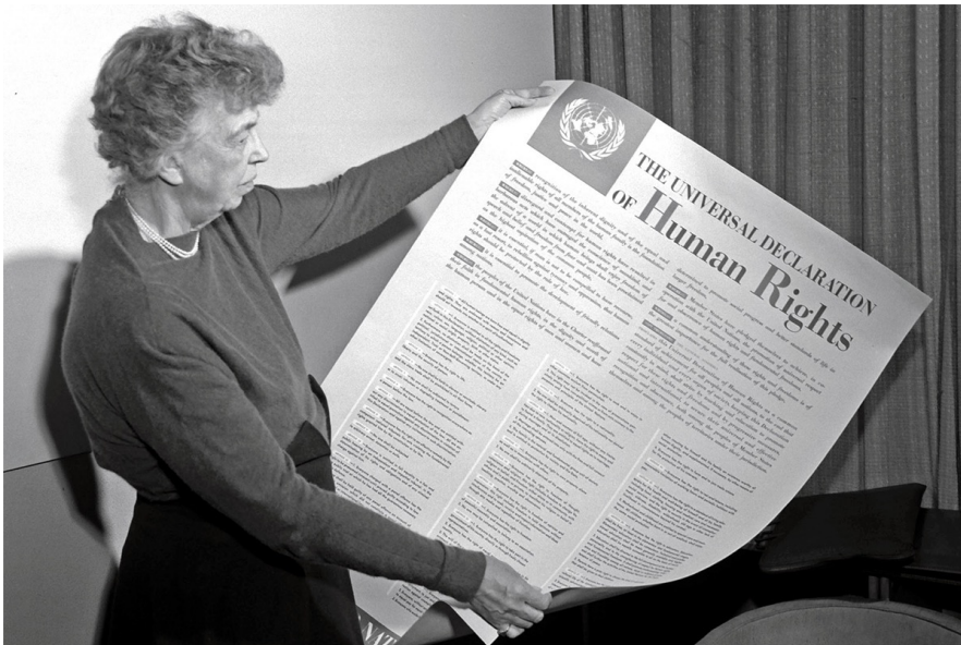
Eleanor Roosevelt con la Carta Internacional de los Derechos del Hombre 3

Todo individuo tiene derecho a la vida, a la libertad y a la seguridad de su persona.