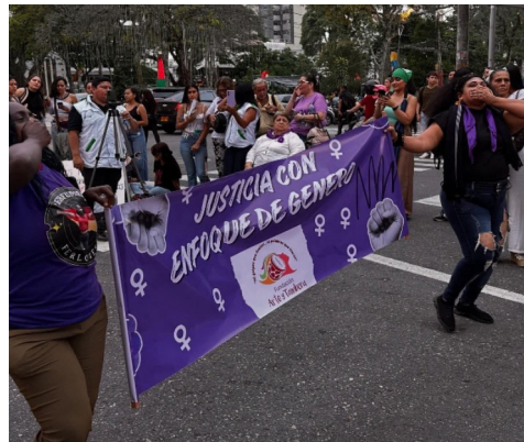
Plantón cultural 25N2025 Ibagué-Tolima 2