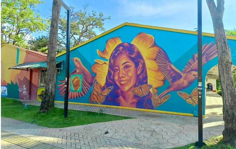
Fotografía tonada en la Universidad del Tolima 2025

Cada 25 de noviembre no es solo una fecha en el calendario: es un grito global para recordar que la violencia contra las mujeres no es una realidad lejana ni un hecho aislado, sino una lucha que atraviesa a todas las mujeres en la vida cotidiana.